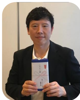
ニアピン賞 廣幡会員