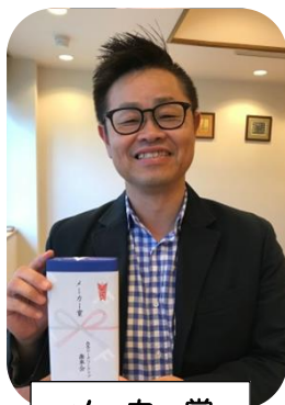
メーカー賞 奥本会員