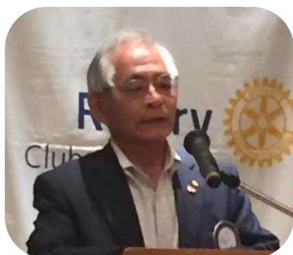
白島ガバナー補佐(東広島RC)