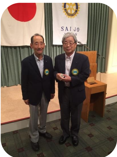
連続100%出席42年 表彰される宇治木会員