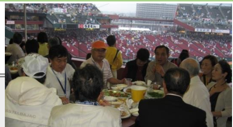
2010年5月17日(日曜日)巨人戦 パーティーフロアにて例会開催

☆8月9日(木)は、マツダスタジアムにて、家族野球観戦例会を開催します。中日ドラゴンズ戦(18時試合開始)を、パーティーフロアにて観戦。チケットを忘れないよう、お気を付け下さい。