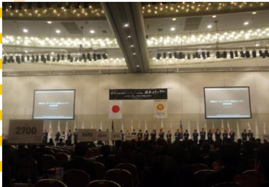
全国ローターアクト研修会